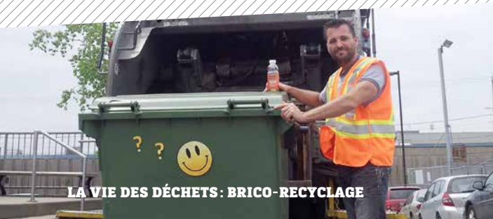
LA VIE DES DÉCHETS : BRICO-RECYCLAGE