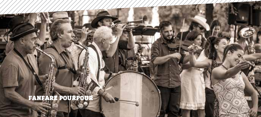
LES BOIS DORMANTS