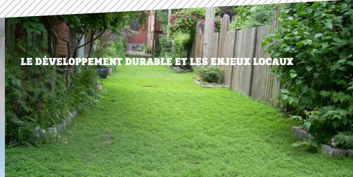
LE DÉVELOPPEMENT DURABLE ET LES ENJEUX LOCAUX

LE MARDI, DU 13 OCTOBRE AU 15 DÉCEMBRE, 13 H 30 - 16 H