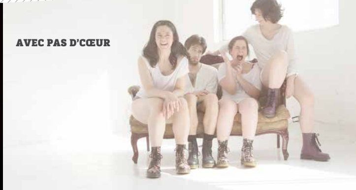
AVEC PAS D'ŒUR