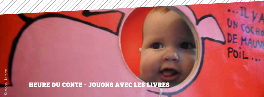
HEURE DU CONTE - JOUONS AVEC LES LIVRES