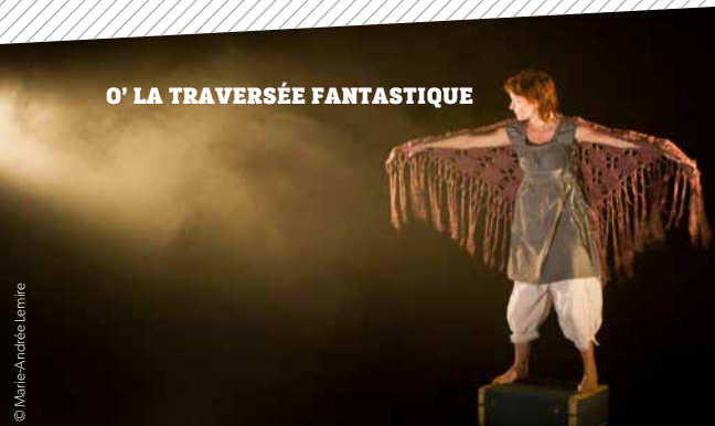
O' LA TRAVERSÉE FANTASTIQUE