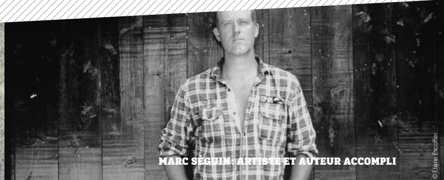
MARC SÉGUIN : ARTISTE ET AUTEUR ACCOMPLI